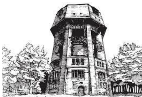
Wieża Ciśnień w Zabrze