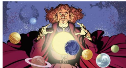
Mikołaj Kopernik - astronom

„Wstrzymał słońce ruszył Ziemię, Polskie Go wydało plemię „